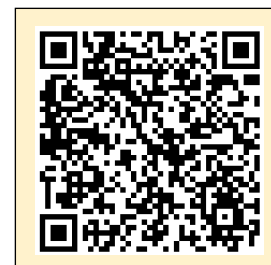
▲「あじかん MAKIZUSHI 倶楽部」 QRコード